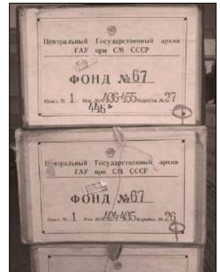
Le premier versement effectué à l'IHS CGT en mars 2000. Un second transfert à l'IHS CGT a été effectué en octobre 2004

Dans La mémoire spoliée, Sophie Cœuré souligne, qu'après la défaite française de juin 1940, comme toutes les archives françaises sont confisquées, celles saisies au siège de la CGT sont expédiées par train en Allemagne . Elles n'auront toutefois pas le temps d'être beaucoup exploitées par les services secrets allemands. En effet, découvertes en 1945 par l'Armée rouge à Berlin , ces archives seront alors considérées comme des prises de guerre de l'URSS, et envoyées à Moscou. Elles seront alors identifiées et classées aux Archives spéciales d'État, mises au secret sous la tutelle du KGB pendant un demi-siècle. Au début des années 1990, la découverte à Moscou de la présence d'archives françaises perquisitionnées en 1940 a été une grande satisfaction pour la CGT. Des négociations entre la France et la Russie ont permis le rapatriement d'un patrimoine exceptionnel, notamment celui de la CGT avant 1940, plus important producteur d'archives privées spoliées.