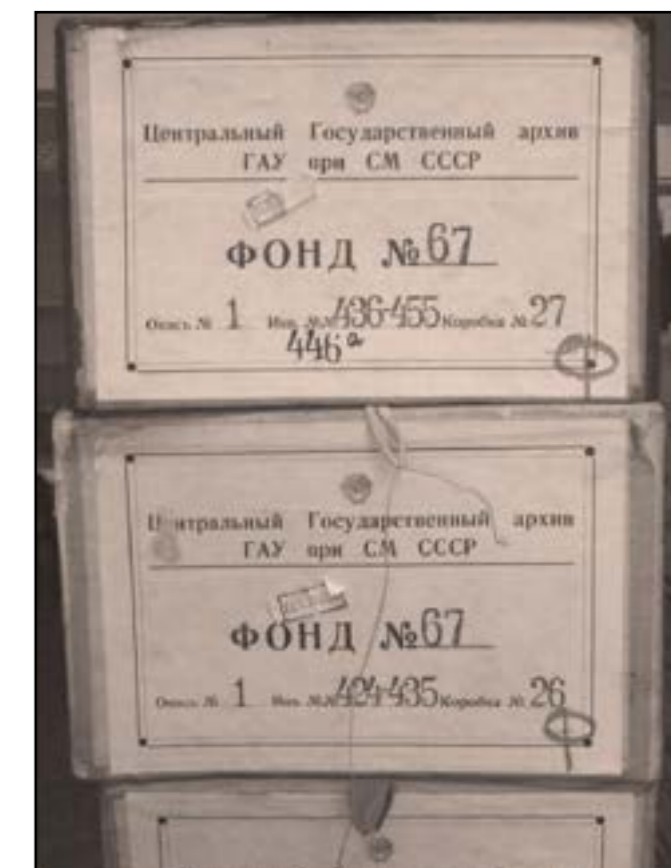
Le premier versement effectué à l'IHS CGT en mars 2000. Un second transfert à l'IHS CGT a été effectué en octobre 2004

Dans La mémoire spoliée, Sophie Cœuré souligne, qu'après la défaite française de juin 1940, comme toutes les archives françaises sont confisquées, celles saisies au siège de la CGT sont expédiées par train en Allemagne. Elles n'auront toutefois pas le temps d'être beaucoup exploitées par les services secrets allemands. En effet, découvertes en 1945 par l'Armée rouge à Berlin , ces archives seront alors considérées comme des prises de guerre de l'URSS, et envoyées à Moscou. Elles seront alors identifiées et classées aux Archives spéciales d'État, mises au secret sous la tutelle du KGB pendant un demi-siècle. Au début des années 1990, la découverte à Moscou de la présence d'archives françaises perquisitionnées en 1940 a été une grande satisfaction pour la CGT. Des négociations entre la France et la Russie ont permis le rapatriement d'un patrimoine exceptionnel, notamment celui de la CGT avant 1940, plus important producteur d'archives privées spoliées.