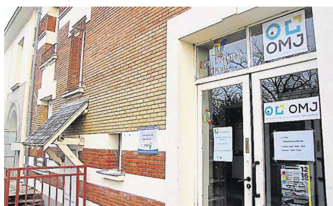
Une grande partie des activités de l'OMJ a été transférée à la Ville en septembre dernier.

L'organisation du programme de l'été a, cependant, pris du retard. Connus des parents à la mi-février l'an dernier, les détails ne seront donnés par la municipalité qu'en mars pour l'été 2017. Exceptionnellement,