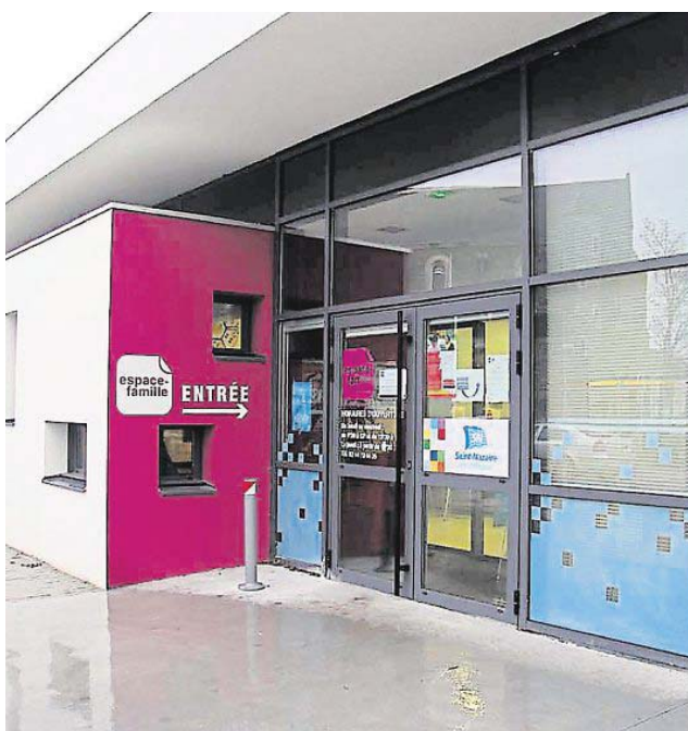
Les modalités d'inscription ont été modifiées en fin d'année dernière.